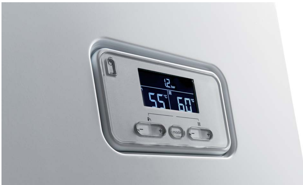
Jednoduchý ovládací panel pro snadnou obsluhu s podsvíceným displejem