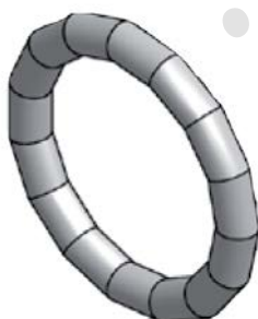
Těsnicí O-kroužek LBP