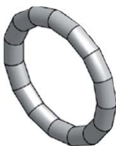
Těsnicí O-kroužek LBP